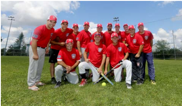
Équipe caserne 28, édition 2014

Le tournoi de balle multicaserne, qui a lieu une fois par année dans une des 5 villes du multicaserne, a été tenue sur le territoire d'Otterburn Park en 2014 car l'équipe otterburnoise était championne en titre. Malheureusement, l'équipe otterburnoise a été défaite en demi-finale. À l'année prochaine à Saint-Basile-le-Grand ou le Service de sécurité incendie de McMasterville défendra son titre.